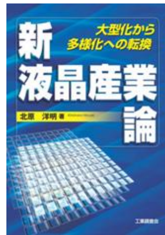
2004年発刊 韓国語訳も発刊