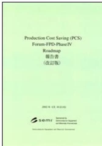
SEMIロードマップオリジナル版 プロセス分科会を担当