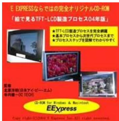
CD-ROMによる判りやすい 「液晶工程」の解説, 2005年版も発刊