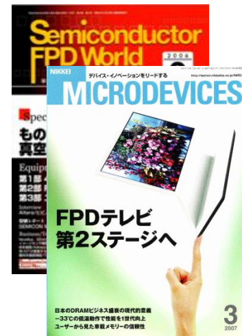
液晶の技術・産業 に関する連載記事