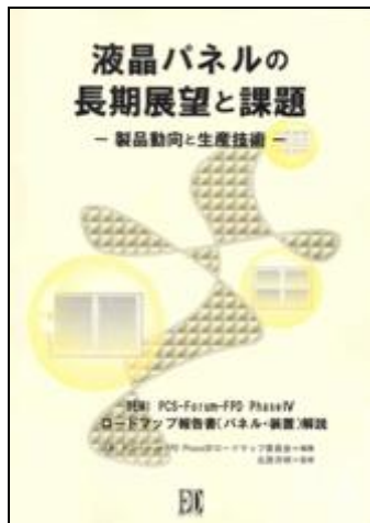
SEMIロードマップの解説本 中国語訳も発刊