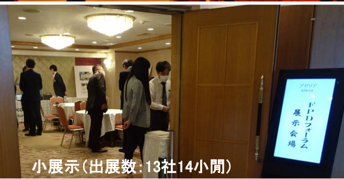
小展示(出展数:13社14小間)